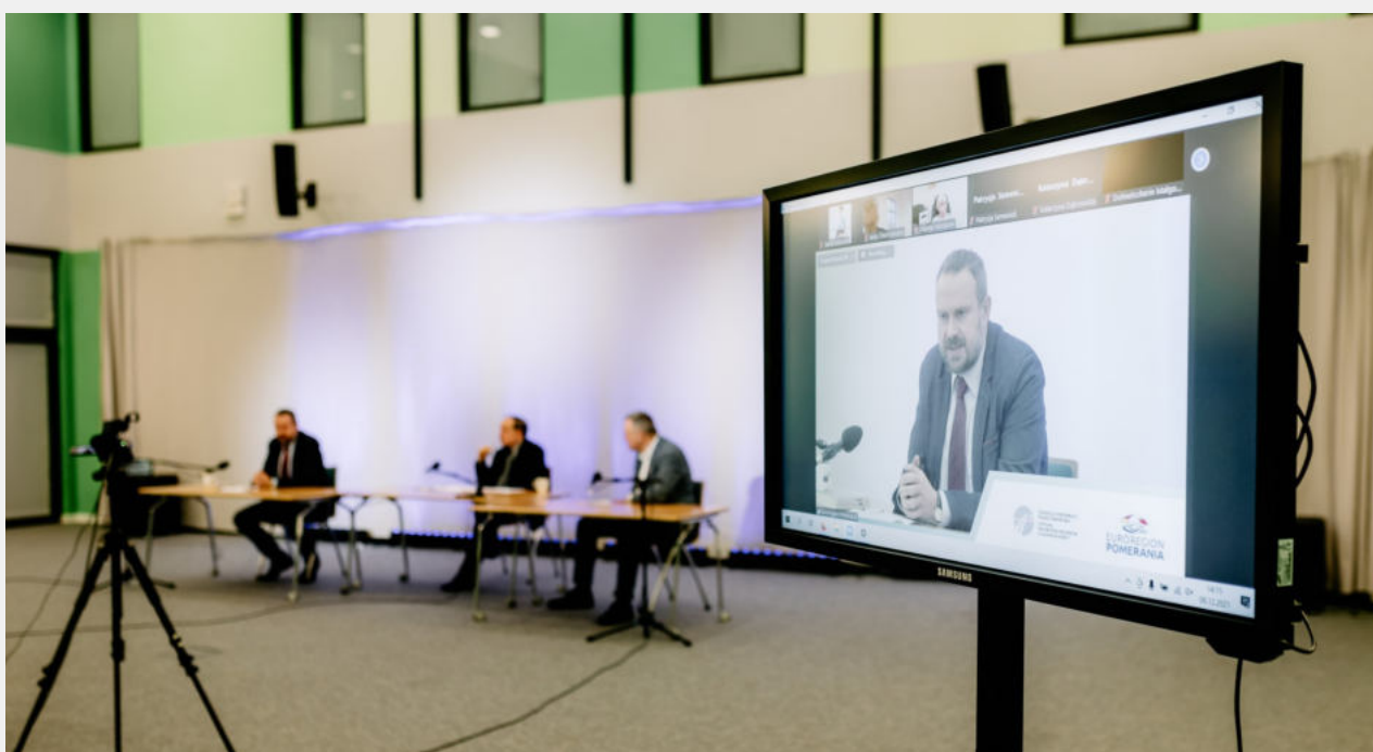
Debata odbyła się w formule on-line