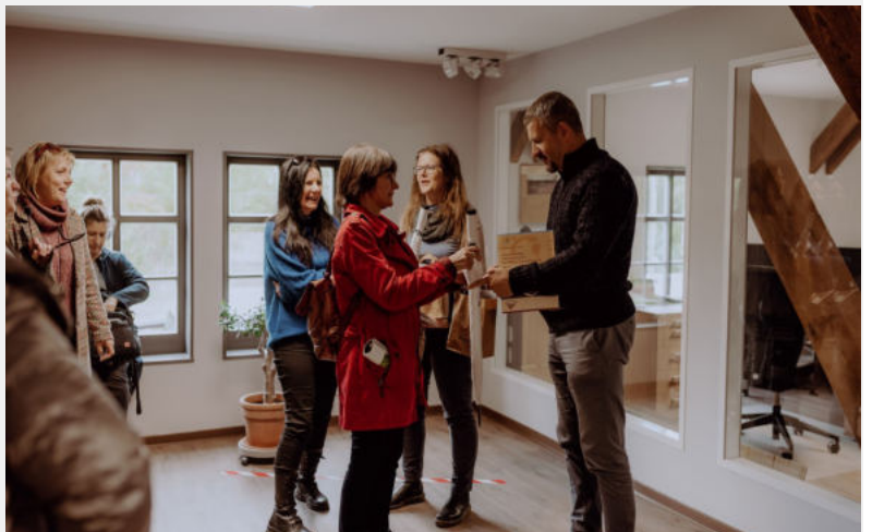
Wizyta w Geoparku Łuk Mużakowa wpisanego na listę UNESCO

W programie kolejnego dnia znalazła się wizyta w Geoparku Łuk Mużakowa, który jest wpisany na listę światowego dziedzictwa Unesco. Park na granicy polsko-niemieckiej chroni widoczną z kosmosu morenę czołową, która powstała w czasie