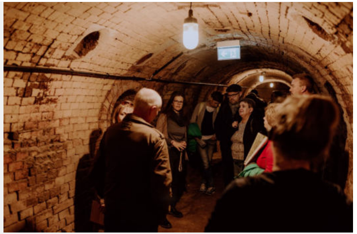
Zwiedzanie zabytkowej cegielni w Klein Kölzig na terenie Geoparku

Atmosferę polsko-niemieckiego pogranicza można było poczuć w bliźniaczym mieście Gubin-Guben, gdzie zostaliśmy zaproszeni przez zarządy obu stowarzyszeń Euroregionu Sprewa-Nysa-Bóbr. Tu znaleźliśmy czas na wymianę doświadczeń z realizacji projektów w ramach Funduszu Małych Projektów, rozmowy o przyszłości naszego regionu przygranicznego oraz o nowych możliwościach, jakie daje nowa perspektywa finansowa 2021-2027.