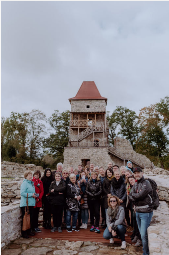
W tle odrestaurowane ruiny Zamku w Starej Kamienicy

Ostatni dzień wyjazdu studyjnego zaplanowany został w Euroregionie Pro Europa Viadrina. Podczas wizyty we Frankfurcie nad Odrą poznaliśmy specyfikę współpracy pomiędzy Brandenburgią a województwem lubuskim. Współpraca pomiędzy uniwersytetami we Frankfurcie i Słubicach stała się znakiem firmowym regionu i tworzy ramy dla współpracy polsko-niemieckiej. Chodzi tu nie tylko o wspólne studia, wymianę pracowników i studentów, ale także o wspólne projekty na rzecz rozwoju regionu, takie jak ochrona przeciwpowodziowa czy wspólne patrole policyjne.