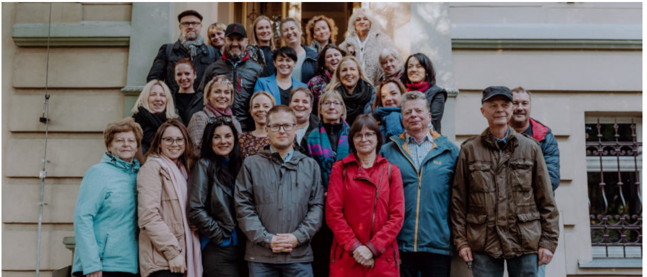
Spotkanie z naszymi kolegami i koleżankami w Euroregionie Sprewa-Nysa-Bóbr w Gubinie