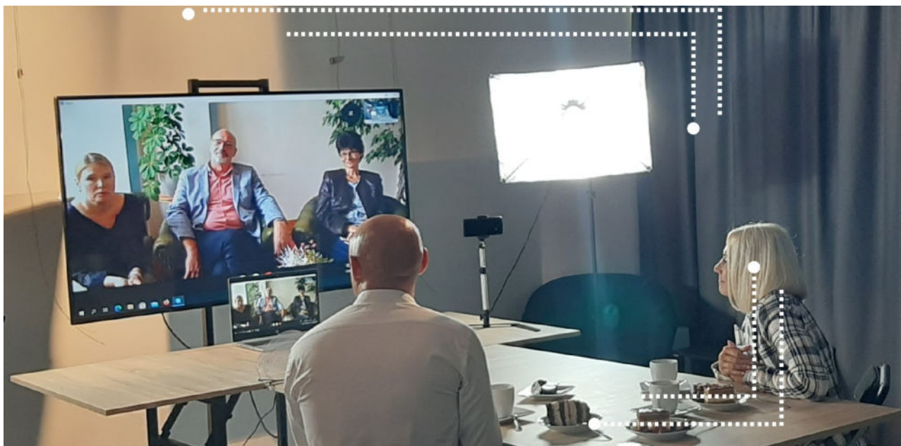
Spotkanie on-line w ramach projektu Polsko- Niemiecka wirtualna strefa relaksu". Pyrzycki Dom Kultury i Stadt Uckermünde.